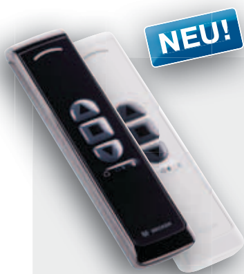
EasyControl EC5401B 1-Kanal Handsender